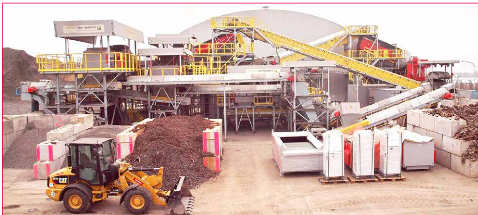
Bild 3: MV-Schlackenaufbereitungsanlage der Firma Tartech in Wiesbaden

Noch bis vor wenigen Jahren wurden laut Angaben der Interessensgemeinschaft der thermischen Abfallbehandlungsanlagen in Deutschland (ITAD) im Zuge einer Ascheaufbereitung aus Abfallverbrennungsanlagen (MVA) lediglich 7,5 Prozent Fe-Metalle und 0,7 Prozent NE-Metalle zurückgewonnen [1]. Im Einsatz sind dabei meist (elektro-)mechanische Verfahren. Durch die ständige Weiterentwicklung der Technik sowie die Nachrüstung bestehender Anlagen konnte die Recyclingquote für NE-Metalle in Verbrennungsanlagen auf etwa 56 Prozent gesteigert werden [14]. Problematisch gestaltet sich die Rückgewinnung von Metallen welche beispielsweise von silikatischer Matrix ummantelt sind. Herkömmliche Magnet- oder Wirbelstromabscheider geraten dort an ihre Grenzen. Durch zusätzliche vorangeschaltete Maßnahmen könnte eine Erhöhung der Recyclingquoten erreicht werden. Im BMBF geförderten r 3 Projekt Aufschluss, Trennung und Rückgewinnung von ressourcen-relevanten Metallen aus Rückständen thermischer Prozesse mit innovativen Verfahren – ATR konnte durch eine Kombination von Hochgeschwindigkeits-Prallbrecher und Wirbelstromabscheider (Bild 3) eine Recyclingquote von über siebzig Prozent realisiert werden [15]. In vorangegangenen Forschungsprojekten konnte nachgewiesen werden, dass es möglich ist enthaltene Metallfraktionen nahezu vollständig durch hydrothermale Lösungsprozesse aus Verbrennungsrückständen heraus zu lösen.