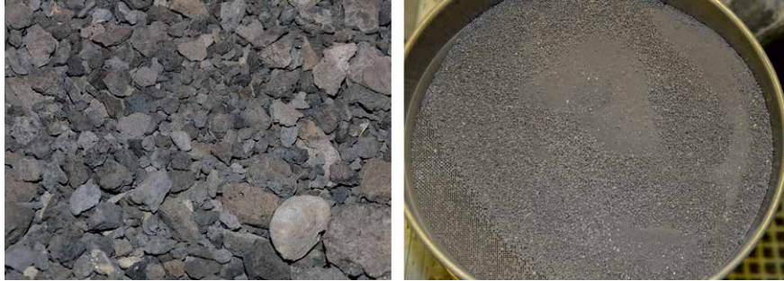
Bild 5: Ausgewählte Probe vor (linkes Bild) und die abgeseibte Fraktion kleiner zwei Millimeter nach der elektro-dynamischen Fragmentierung (rechtes Bild)

Es wurden etwa sechs Kilogramm Material kleiner zwei Millimeter je Probe hergestellt. In Bild 5 ist beispielhaft eine Probe vor und nach der Fragmentierung gezeigt. Nach einer Siebturmanalyse wurden die einzelnen Fraktionen ( < 2 \text{ mm} , < 1 \text{ mm} , < 500 \mu\text{m} , < 250 \mu\text{m} , < 125 \mu\text{m} , < 63 \mu\text{m} ) jeder Probe zur weiteren Aufbereitung mittels hydrothormaler Extraktion vorbereitet.